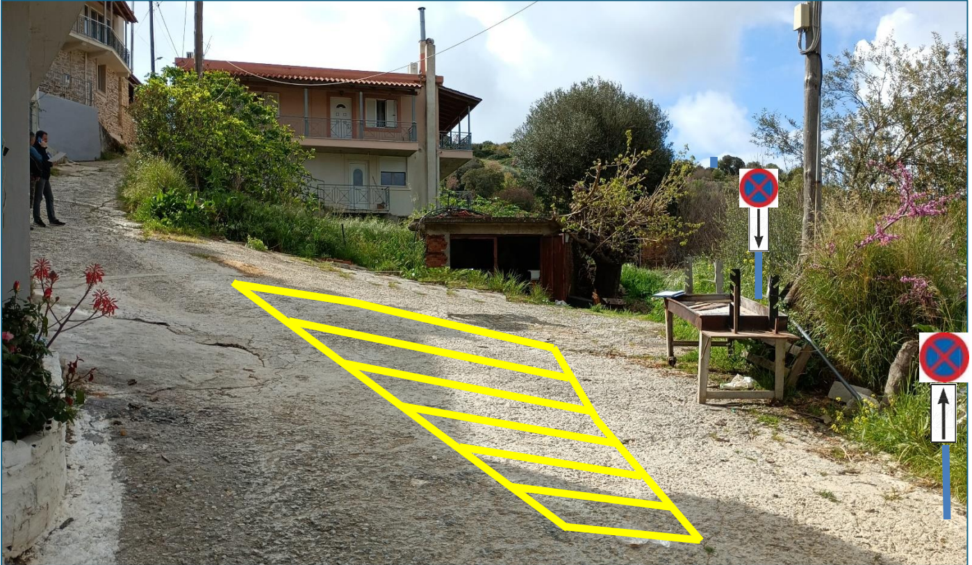
ΕΙΚ.-3: ΕΝΔΕΙΚΤΙΚΗ ΘΕΣΗ ΝΕΑΣ ΚΑΘΕΤΗΣ & ΟΡΙΖΟΝΤΙΑΣ ΣΗΜΑΝΣΗΣ

Για τη συμπλήρωση επαρκούς οριζόντιας σήμανσης, με τα κατάλληλα υλικά του νέου Κώδικα Οδικής Κυκλοφορίας - Κ.Ο.Κ. του Ν.2696/1999 (Άρθρο 5 Οριζόντια σήμανση οδών) και της έγκρισης των τεχνικών οδηγιών κυκλοφοριακών παρεμβάσεων στο αστικό περιβάλλον, στα πλαίσια βελτίωσης της οδικής ασφάλειας, Αριθ. Απόφ. ΔΜΕΟ/Ο/3050 Υπουργού Υποδομών, Μεταφορών και Δικτύων (ΦΕΚ 2302 τ.Β'/19-9-2013), προτείνονται στις θέσεις αυτές όπως είναι σημειωμένες και φαίνονται στην εικ.-3 ως εξής: