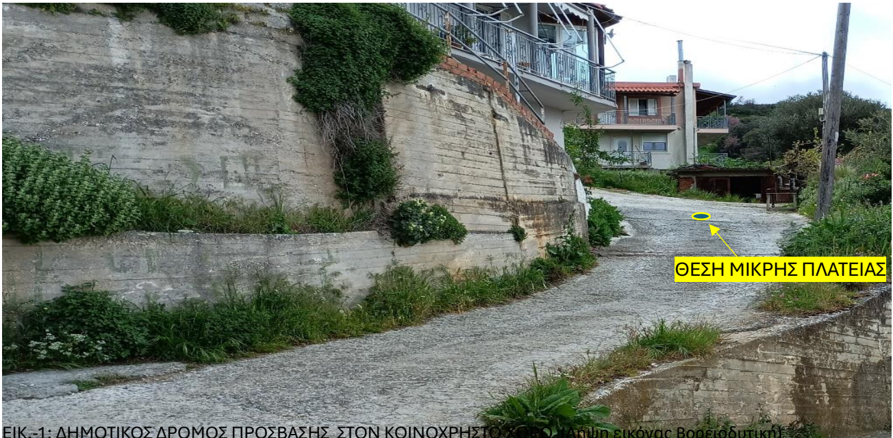
ΕΙΚ.-1: ΔΗΜΟΤΙΚΟΣ ΔΡΟΜΟΣ ΠΡΟΣΒΑΣΗΣ ΣΤΟΝ ΚΟΙΝΟΧΡΗΣΤΟ ΧΩΡΟ (Αθήνη εικόνας Βορειοδυτική)