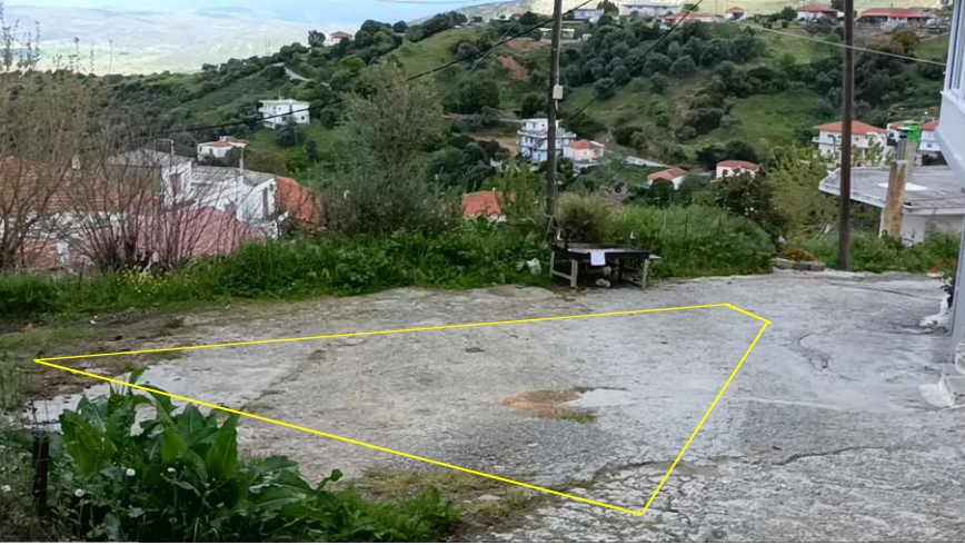
ΕΙΚ.-2: ΚΟΙΝΟΧΡΗΣΤΟΣ ΧΩΡΟΣ (Λήψη Νοτιοανατολική)