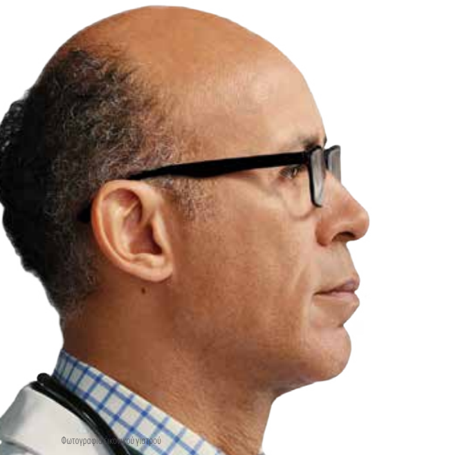
Φωτογραφία εικονικού γιατρού