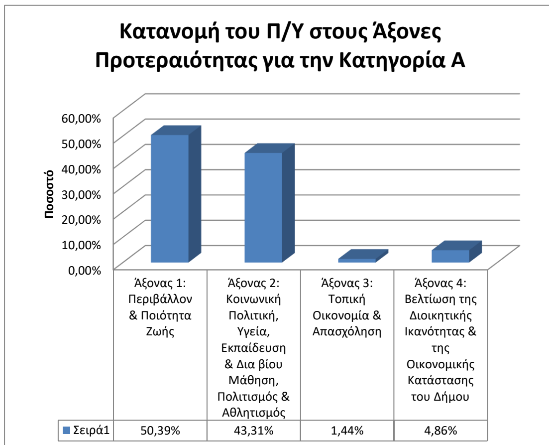
Διάγραμμα 3: Κατανομή του Π/Υ στους άξονες για δράσεις Κατηγορίας Α

Το ποσοστό του Άξονα 4 οφείλεται στο σύνολο των επιχορηγήσεων που αποδίδει ο Δήμος σε ΝΠ και άλλους φορείς.